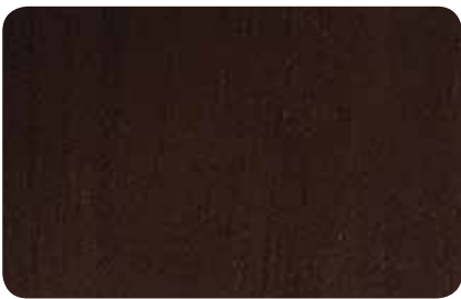
NOGAL OSCURO TEXTURADO