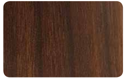
NOGAL ESPAÑOL TEXTURADO