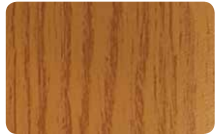
ROBLE CLARO TEXTURADO